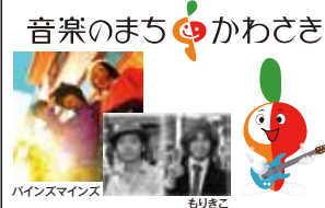
音楽のまちかわさき バインスマインズ もりさこ