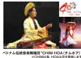
ベトナム伝統音楽舞踊団「CHIM HOA (チムホア)」 ※CHIMは鳥、HOAは花を意味します。