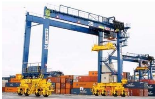
① 港湾施設の機能高度化、物流システム高度化施設の整備、物流効率化機械設備等の導入

京浜港のコンテナターミナル等において、以下の①、②を実施する事業者が、地域再生協議会の構成員である金融機関から融資を受けて施設整備を実施する場合に、貸付の日から 5 年間、国が 0.7%以内で金融機関に対し利子補給金を支給する。