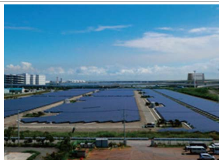
② 再生可能エネルギーの活用や災害対策を目的とした自家発電設備導入等の推進