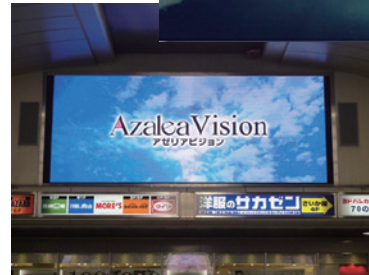
JR川崎駅東口側 (アゼリア地下街側)に 設置されている 大型画面