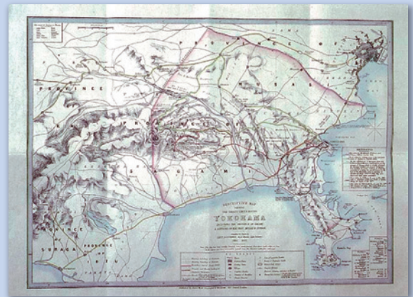
ヨコハマに居留する外国人の遊歩域を示した地図。 赤いラインで引かれた内側が、そのエリアであった

既に世界から人が訪れるエリアでした。カワサキは、ペリー来航の時代には、特に入気だったのが川崎大師で、大勢の観光客が集った痕跡が、本や写真などで紹介されています。