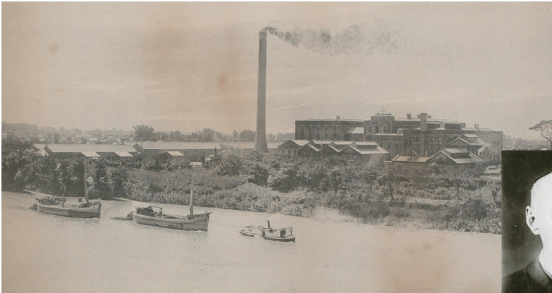
横浜精糖株式会社