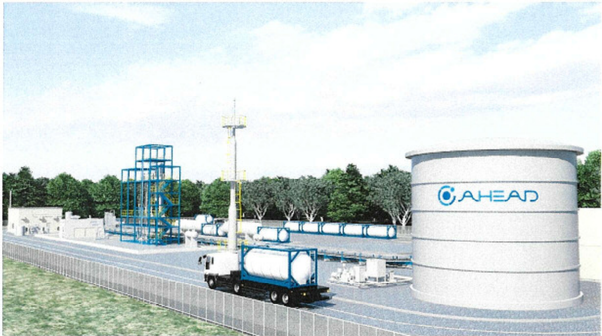
ブルネイ水素製造及び水素化プラント