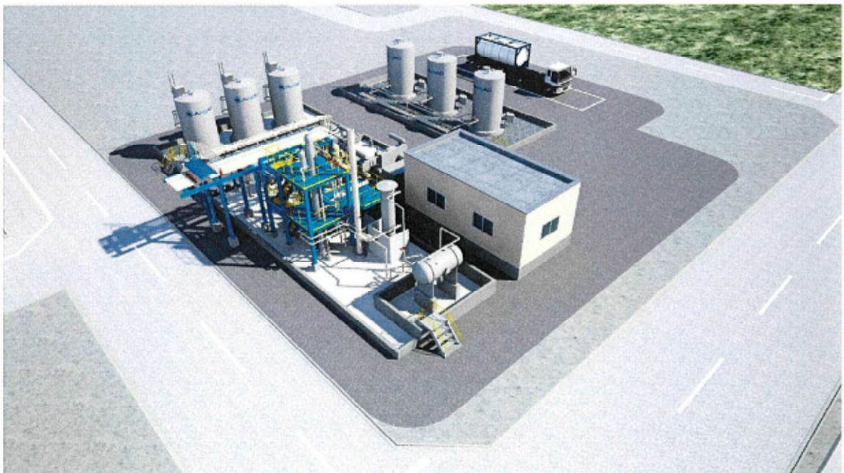
川崎脱水素プラント