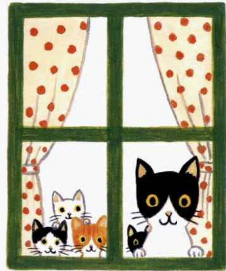
イラスト とりこえまり