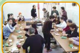
地域の人たちが集う「まちの縁側」