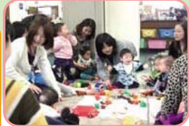
親子連れでにぎわう「子育てサロン」