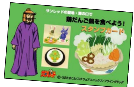
鶏だんご鍋スタンプラリーカード