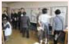
ポスターセッションでの活発な意見交換

その他の催し ジャンボカルタ大会・カルタ展示、地域の食材を使ったランチ(有料)、クイズラリー、お楽しみ抽選会や、工作、琴、絵手紙、お茶、お花、風呂敷包みなどの体験コーナーなど、子どもから大人まで楽しめる催しが盛りだくさんです。 区役所地域振興課(区まちづくり協議会事務局) ☎856-3125、FAX856-3119