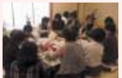
フラワーアレンジメントなどの体験が楽しめます