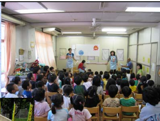
保育園での出前授業の様子

平成20年度においては、 区内保育園や子ども文化 センターにおいても出前授 業を実施しました。