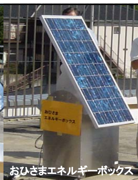
おひさまエネルギーボックス