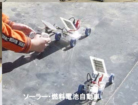
ソーラー・燃料電池自動車