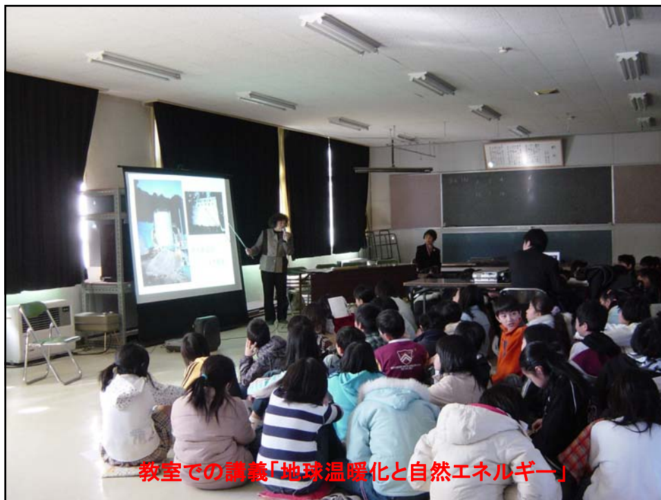
教室での講義「地球温暖化と自然エネルギー」