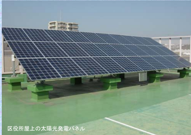
区役所屋上の太陽光発電パネル