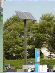
区役所前広場の外灯