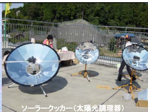
ソーラークッカー(太陽光調理器)