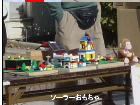
ソーラーおもちゃ