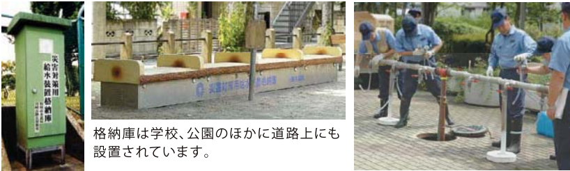
格納庫は学校、公園のほかにも道路上にも設置されています。

応急給水拠点には、給水に必要なポンプや蛇口などの器具をしまっておく格納庫があります。地震が起きて断水したときは、格納庫から器具を取り出し、地下に埋めてある貯水槽、貯留管、耐震性に優れた水道管に取り付けて給水します。外出したときにご家庭の近くで格納庫を見つけたら場所を覚えておきましょう。