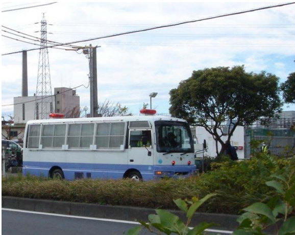
路上駐車車両への注意喚起 (川崎臨港警察署)