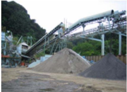
粒状改良土プラント