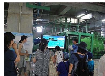
夏休み上下水道教室