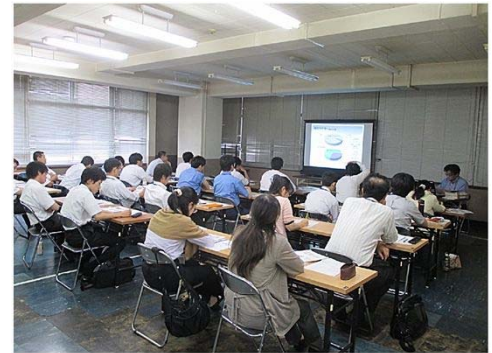
新規採用職員研修