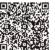
携帯電話用QRコード