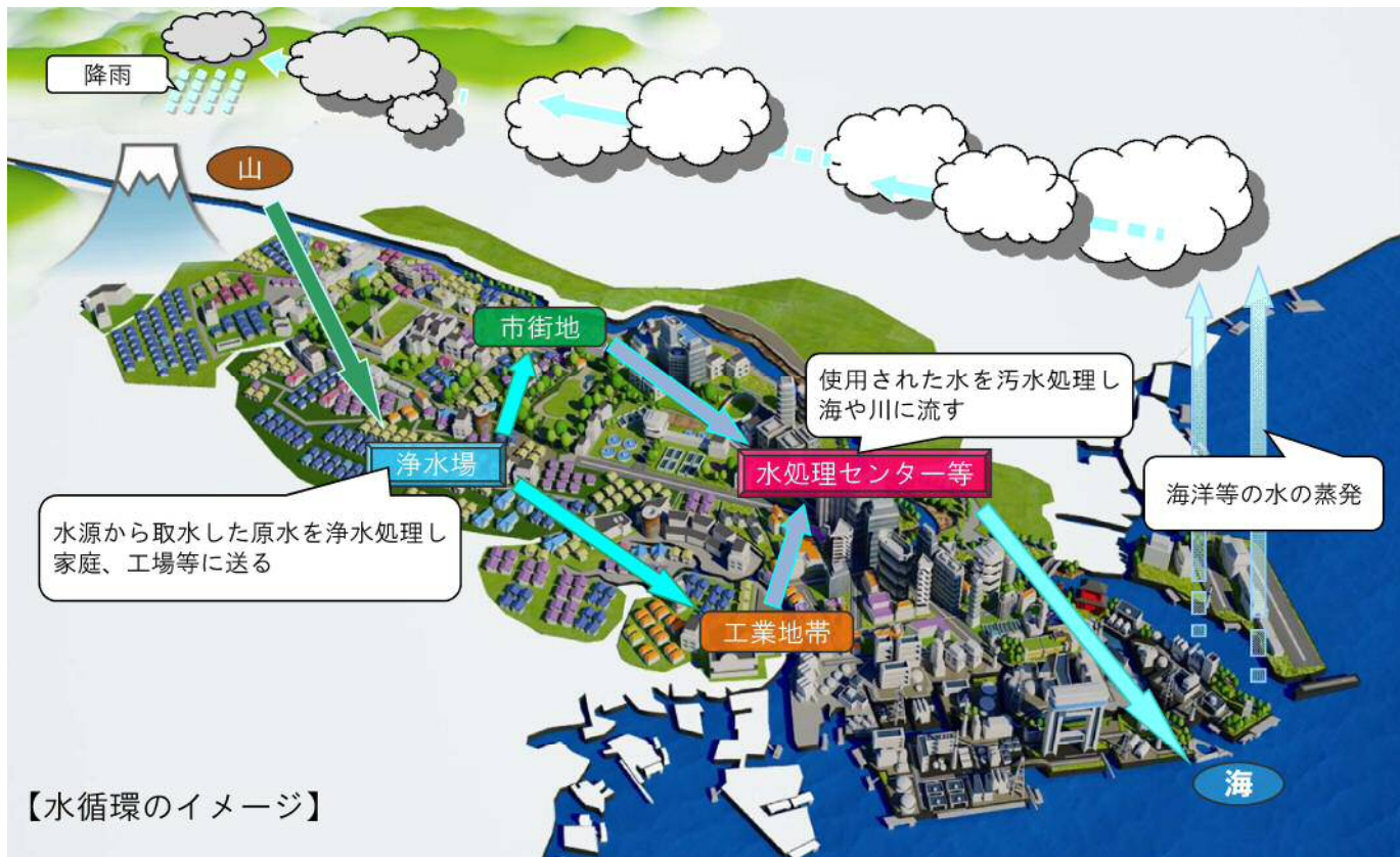
【水循環のイメージ】

川崎市では、平成22(2010)年4月に水道事業、工業用水道事業及び下水道事業の組織を統合した上下水道局を設置し、「水循環を基軸とした環境施策の推進」を統合理念の一つに掲げ、3事業の一体的な取組による地球温暖化対策や資源循環型社会の構築など各種の環境施策に取り組んでいます。