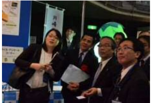
川崎国際環境技術展2018