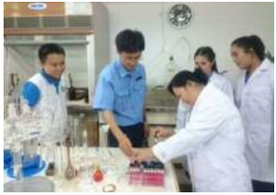
JICAラオス国水道公社事業管理能力向上プロジェクト