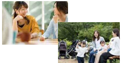
c コミュニティプラザ

ふれあい広場、スポーツ広場、クラブハウス、多目的広場を空間的に連続させ、つながりを生み出す配置は、利用者の交流の場、賑わいを生み出す場として多目的に利用できます。