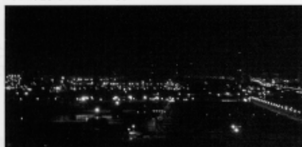
「川崎マリエン」からの眺め(扇島方向)

もっと気軽に工場地帯の夜景を堪能するのなら、「川崎マリエン」の展望室がおすすめだ。扇島の製鉄工場が橙色に輝く光景は美しく、一見の価値がある。地図を手元に置くか、周辺の地理を頭にいれておくと、なお楽しめる。