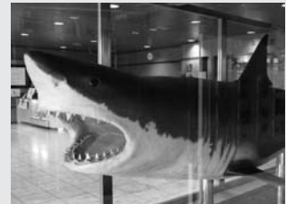
川崎港で実際に揚がった世界最大級のホオジロザメの剥製「かわじろ」