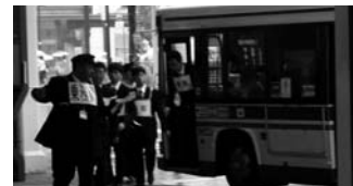
乗務員によるお客様の避難誘導