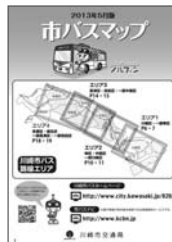
最新市バスマップ