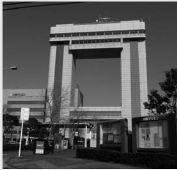
川崎マリエンの正面玄関。ドラマのロケ地として使用されることもあります。

川崎駅東口から市バスで30分。川崎港の玄関口にある「川崎マリエン」は、川崎港と市民の交流を深めるために生まれたコミュニティ施設です。