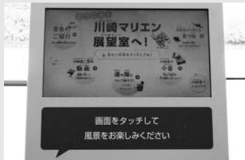
展望室に設置された案内パネル。是非、タッチしに来てください。

他にもマリエンには、バーベキュー場やビーチコート等のアミューズメント施設が盛りだくさん。海風が心地よく感じるこれからの季節、是非、市バスでお出かけしてみたいはいかがでしょうか。