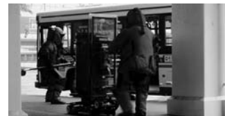
機動隊による爆発物処理