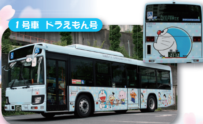
1号車 ドラえもん号