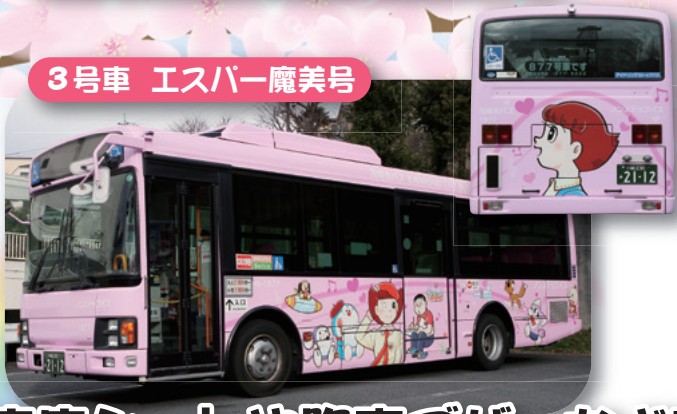
3号車 エスパー魔美号