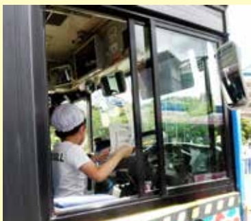
運転席に座り、バスの死角を実体験