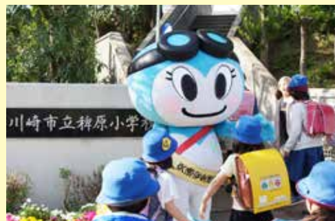
稗原小学校前の横断歩道で、主に新入学児を対象として安全確保活動を行いました！