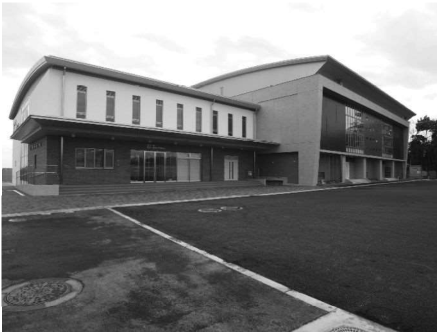
消防訓練センター