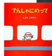
「でんしゃにのって」 アリス館