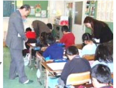
学習支援ボランティアの様子

日程 10月1日～12月17日 土曜 午後2～4時 対象 学習支援ボランティアに関心のある方 30名 費用 無料 会場 菅生分館 (蔵敷バス停そば 子育て支援センターすぐお(旧菅生幼稚園)隣) 申込 9月16日(金)10:00 から電話 977-4781 で菅生分館へ