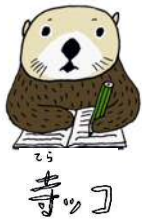
寺ッコ ラッコ界の王子