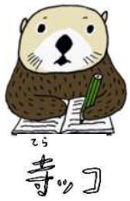
寺ッコ ラッコ界の王子

寺ッコは、ラッコ界の危機を救おうと、人間の知恵を学びにやってきた王子様です。 寺子屋の門下生として登録しました。 人間の子とも達と一緒に寺子屋で学んでいます。