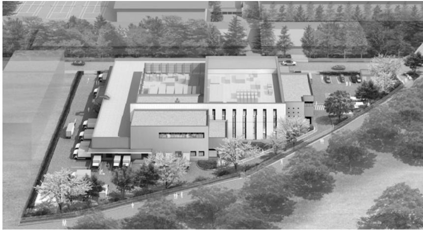
■ (仮称) 川崎市中部学校給食センター外観イメージ図