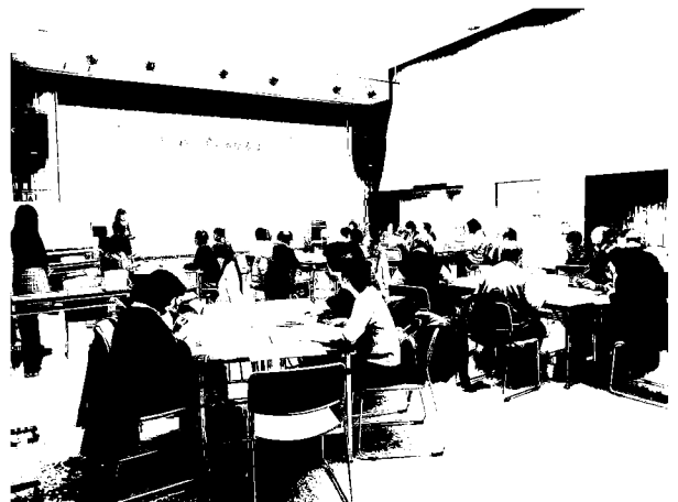
幸市民館 生涯学習交流集会 「さいわい学びの広場」

また、広く市民の活動や市民学習グループのエンパワーメントに資するため、生涯学習的側面から支援していく各種事業を行った。