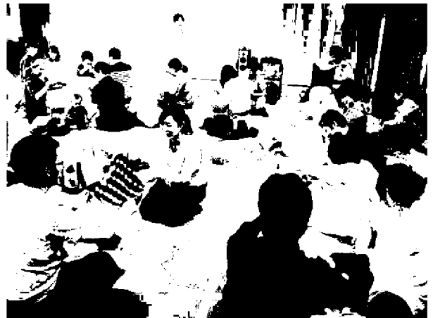
多摩市民館 家庭・地域教育学級 「笑顔育む0歳の子育て講座 Part 1」

平和・人権、環境や男女共同参画社会、LGBTなど、現代社会において市民生活を営む上で、年齢や性別にかかわらず、普遍的な課題を解決するため学習機会を提供し、市民意識の啓発や共生社会の形成に必要な能力を養うことを目的として開設した。