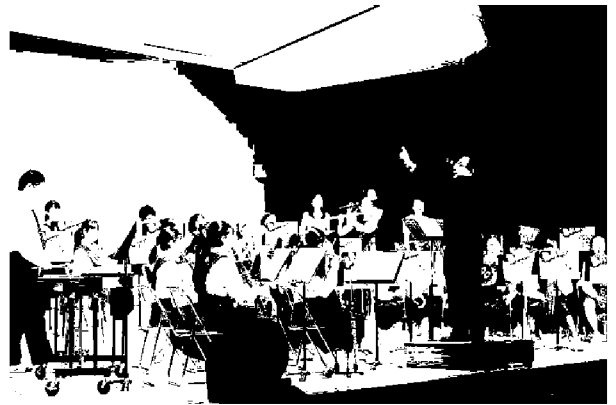
地域課題対応事業「ホール DE コンサート」

地域とそこで暮らす市民、学校、区役所や市民館などが連携し、協力して学習活動を発展させている。また、広く学習にかかわる情報や人などのネットワークづくりを進め、生涯学習活動やボランティア活動、市民活動を積極的に支援している。