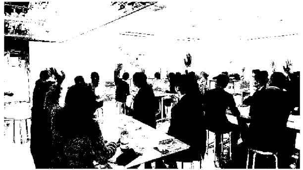
生涯学習研修 「グラレコ」