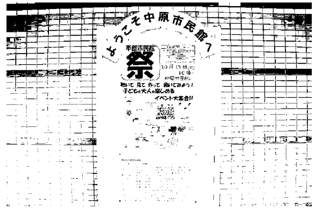
中原市民館移転10周年記念イベント 「中原市民館 祭」

今年度より、社会人学級については、より広く参加者を募るため、公益財団法人川崎市生涯学習財団に委託の上、実施することとした。