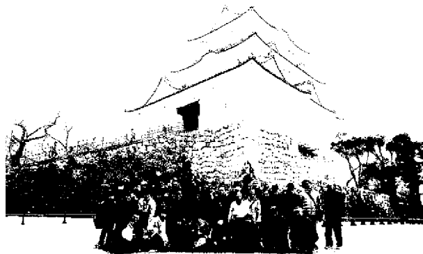
宮前市民館障がい者社会参加学習活動 「バスハイク」

社会参加の機会が少ない市民を対象に、社会参加を促進するための支援学習を行った。外国人市民等（外国人市民や帰国した日本人市民）が日常生活に必要な日本語などを学ぶ識字学習活動、障がいのある人の余暇活動と社会参加をめざす障がい者社会参加学習活動等の事業を各区の地域性を活かしながら実施した。