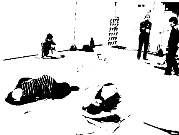
教育文化会館 シニアの社会参加支援事業(活動コース) あなたの「できること」教えてください講座(ヨガ体験)

シニア世代が、これまで社会で培った豊富な経験と知識、多様な能力を活かし、これまで関わりの少なかった地域社会での様々な活動に参加できるよう支援することを目的に平成20（2008）年度から開設した。平成23（2011）年度に「入門コース」に加えて「活動コース」を新設した。