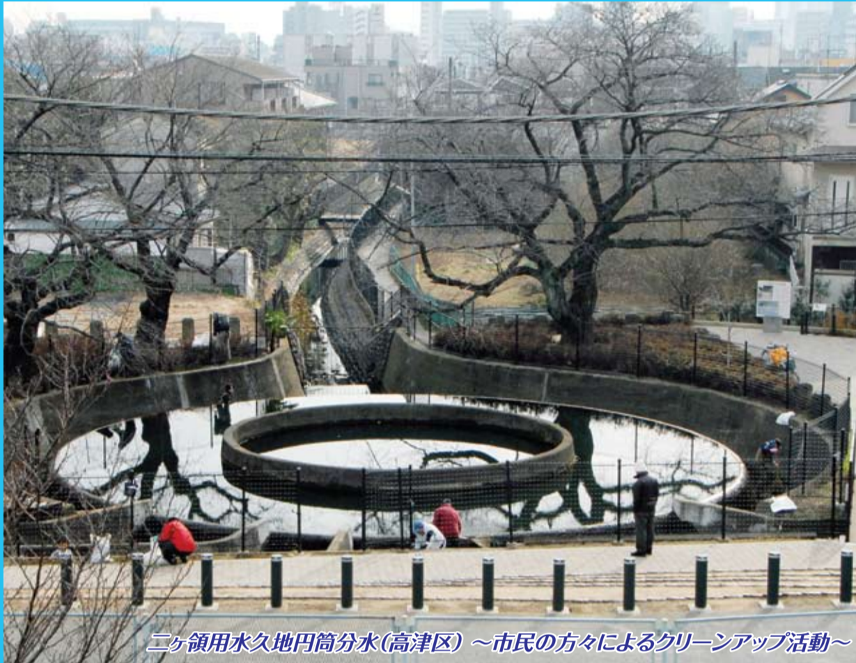
二ヶ領用水久地円筒分水(高津区) ~市民の方々によるクリーンアップ活動~