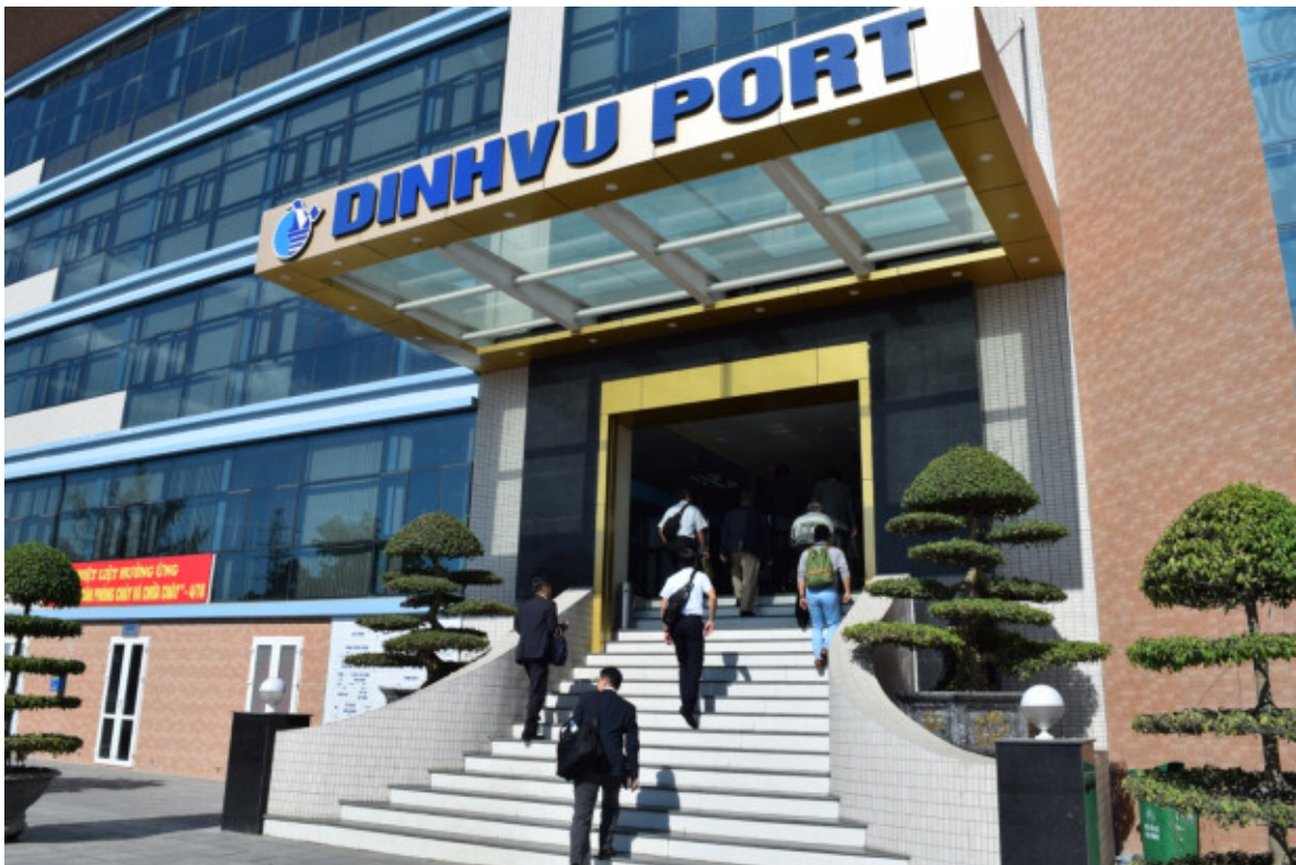
DINH VU PORTの正面玄関にて

アジア視察1日目は、日本から首都ハノイ市を経由した後、ハノイから東に約120kmに位置するハイフォンへ移動、宿泊し、2日目の午