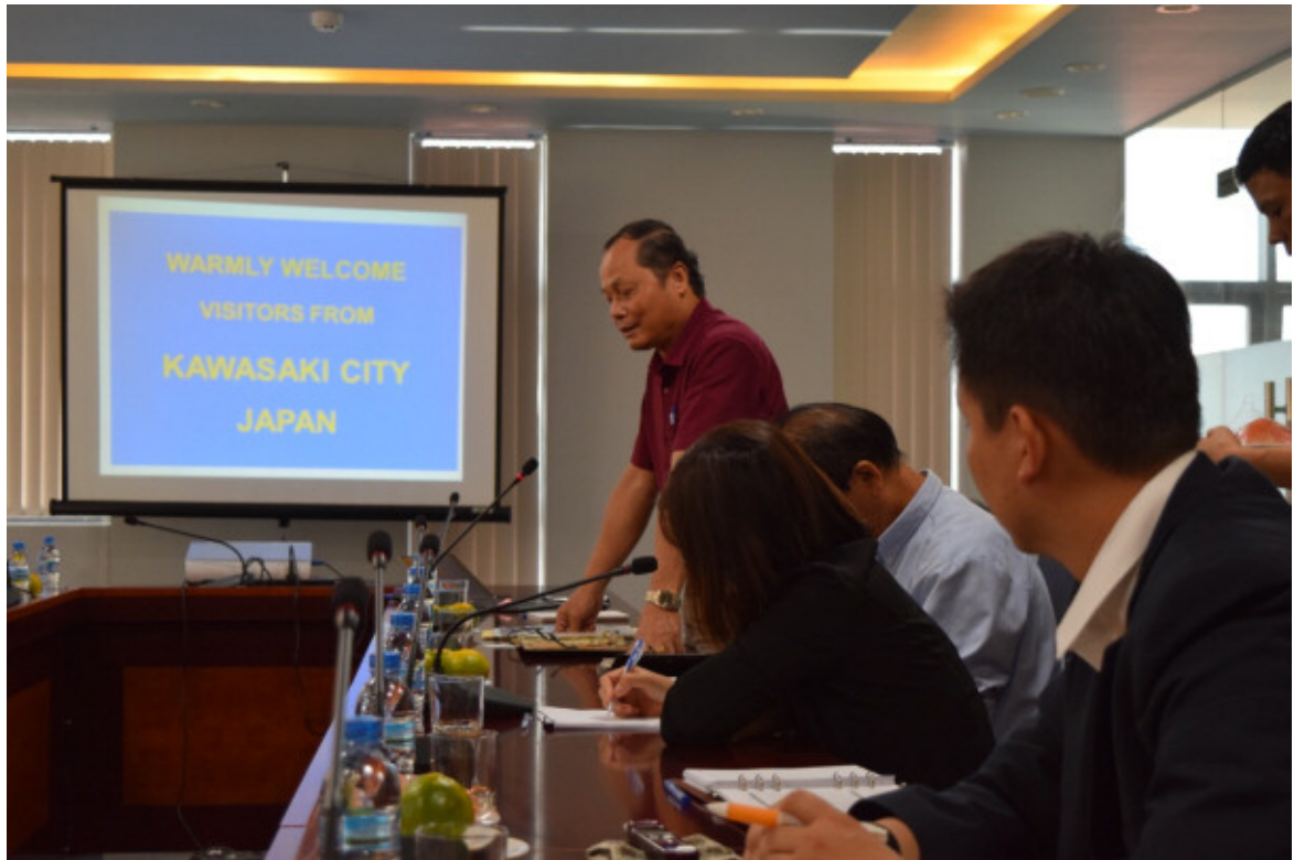
DINH VU港 責任者より挨拶