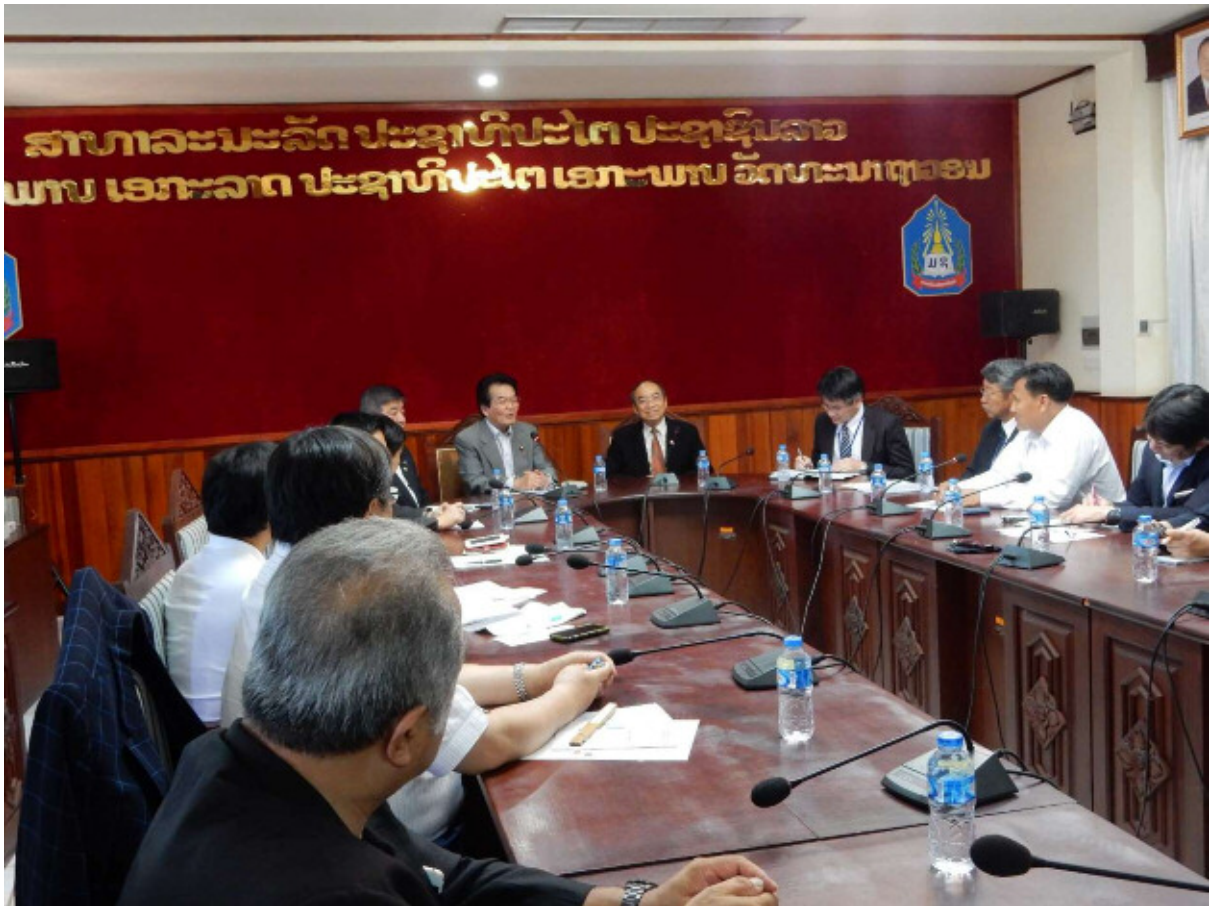
視察後、ラオス国立大学副学長を表敬訪問