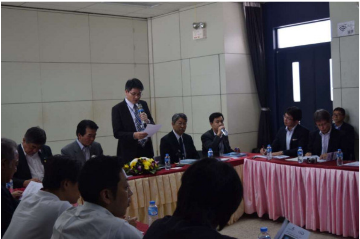
所長による歓迎の挨拶