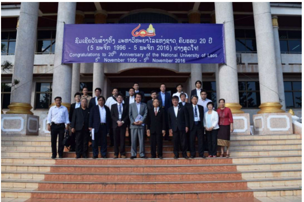
ラオス国立大学にて