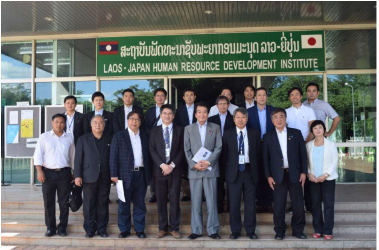
ラオス国立センターにて