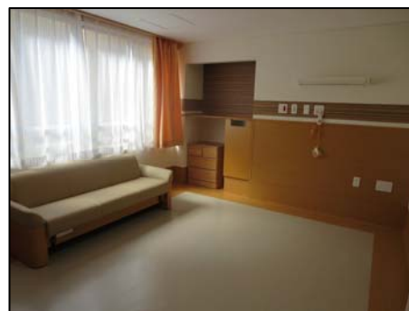
【ケアセンターの新しい病室】