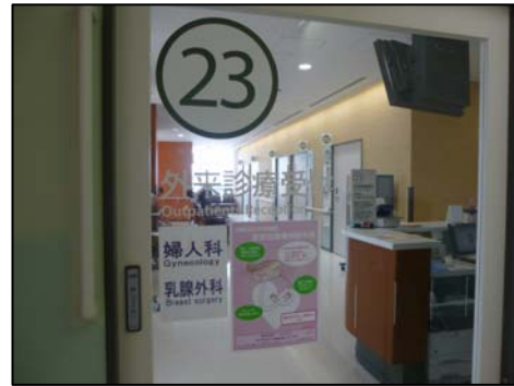
【家族性腫瘍相談外来の受付】

平成26年4月4日、井田病院では家族にがんにかかった人が多くいる場合など、遺伝的な問題をお持ちの方への相談窓口として、「家族性腫瘍相談外来」を開設しました。自分のがん家系ではないかと不安をお持ちの方へ、カウンセリングや必要に応じて遺伝子検査を行うなど問題を解決するお手伝いをしています。