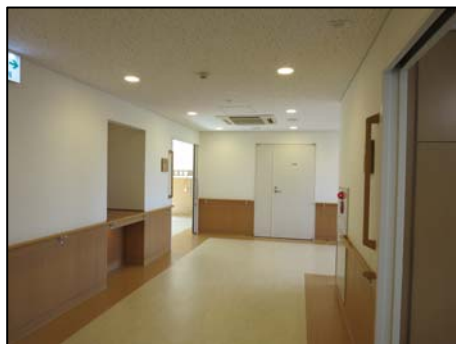
【改修工事後のケアセンター内の様子】