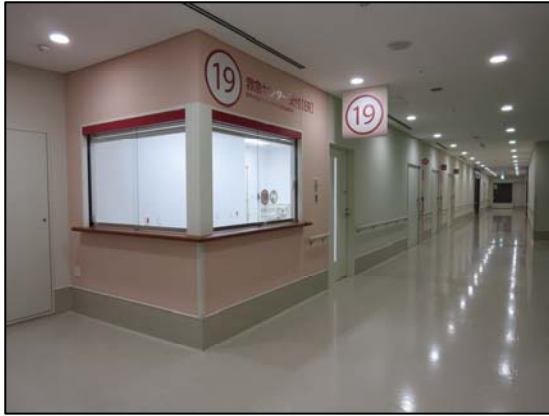
【救急センター受付】