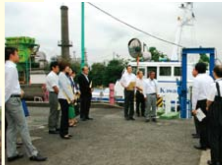
現地向向いて視察している様子