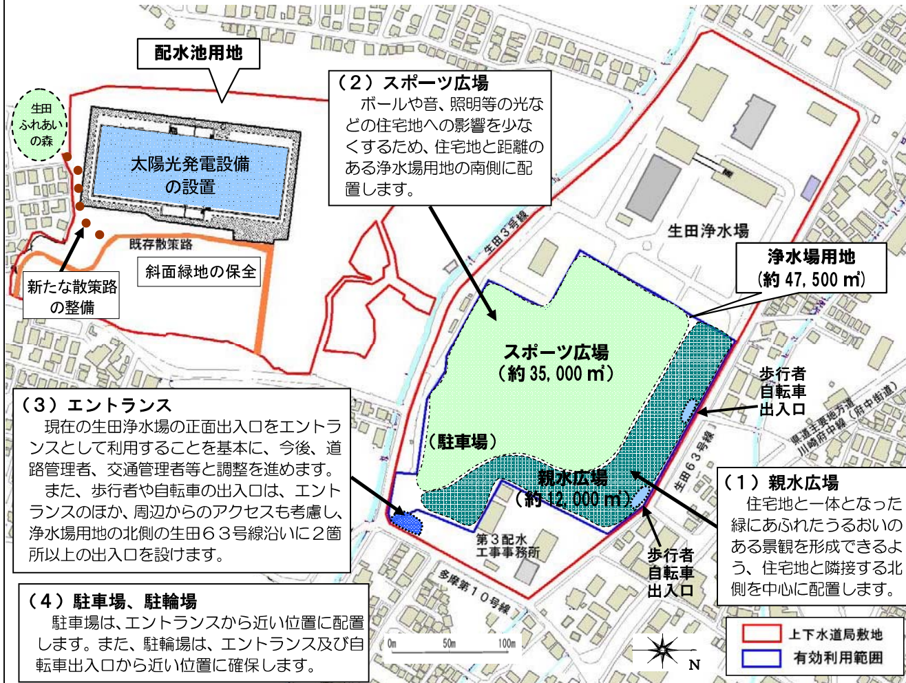
施設等の配置イメージ図

(3) エントランス 現在の生田浄水場の正面出入口をエントランスとして利用することを基本に、今後、道路管理者、交通管理者等と調整を進めます。 また、歩行者や自転車の出入口は、エントランスのほか、周辺からのアクセスも考慮し、浄水場用地の北側の生田63号線沿いに2箇所以上の出入口を設けます。