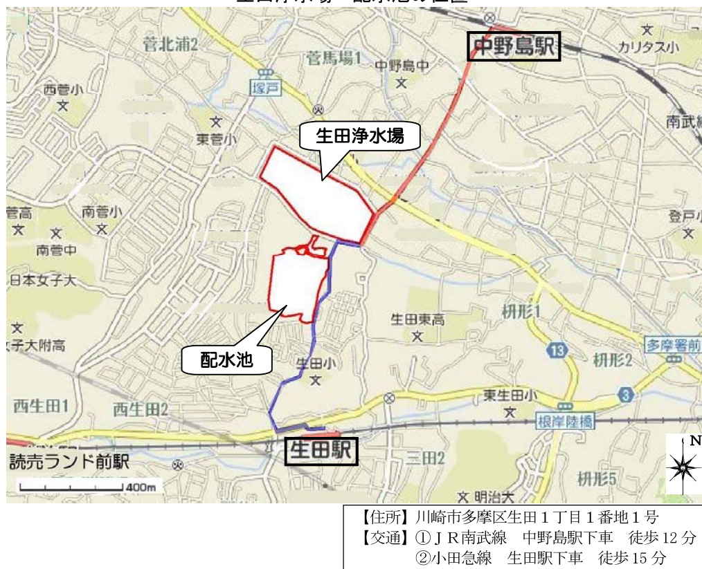
生田浄水場・配水池の位置