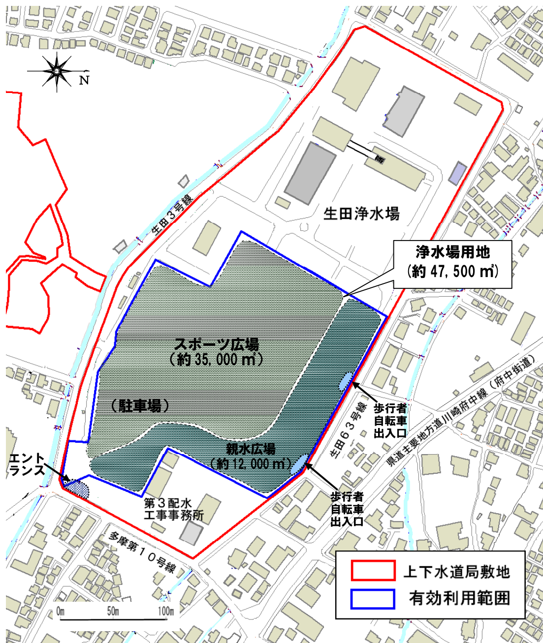
施設等の配置イメージ図