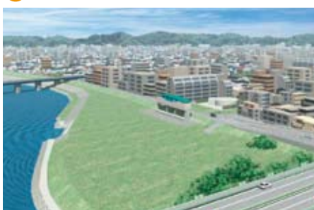
五反田川放水路の多摩川放流部の完成予想図

A 27年度から登戸2号線の切り直し道路の整備に着手し、堤外水路の本体築造などを行い、工期は約3年程度を要すると考える。