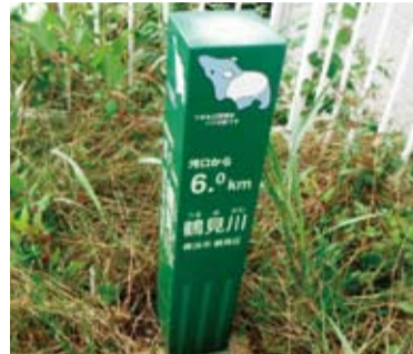
鶴見川の横浜市側に設置されている河川の距離標

Q 河川を利用する市民のために、鶴見川の川崎側と矢上川に設置しては。 A 他都市の事例や市民からの要望などを勘案しつつ、河川管理者である国土交通省などと調整を図りながら検討したい。