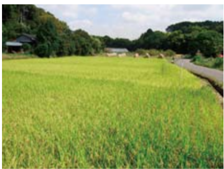
川崎市内にある水田(麻生区黒川地区)

Q 対策の進捗状況と今後の見通しは。 A 24年度に3つの自治体を参考事例として絞り込み、25年度はそれらの施策に対しヒアリングを行い、市の実情に合った支援制度や制度運営などを検討していく。