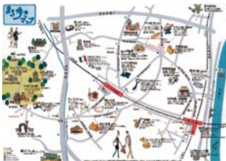
生田緑地周辺のガイドマップ

Q 商店街の活性化には観光資源を生かした区全体の回遊性が必要だが、検討は。 A 区観光協議会では案内マップなどを発行し、商店街連合会は生田緑地 3 館の割引券付き商品券を発行するなど、回遊性の向上に向けた取り組みを行っている。