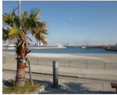
東扇島東公園(川崎区)

▲ 現在、川崎港では小型船の船着き場となり得る候補地の調査を実施しており、立地の可能性を検討している。