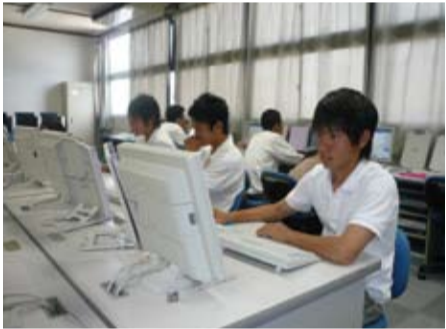
市立中学校でのパソコンを使用した授業の様子

▲ モデルケースとして、26年4月に開校する川崎高等学校附属中学校で研究教員を対象に研修プログラムを導入する。