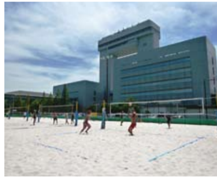
25年7月から4面になったビーチバレー場(川崎区東扇島)

▲ 学生の大会など利用者の増加への対応から、コート数を増やすための改修工事を行っており、25年7月末から市民の利用が可能となるよう整備を進めていく。