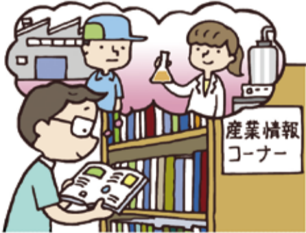
産業情報コーナー

▲ 県の予算編成に対する要望書などで、県による市内での産業情報機能などの機能存続を申し入れてきた。