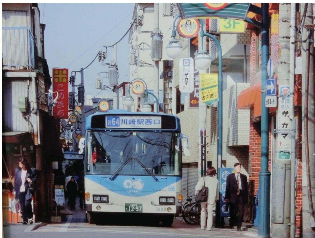
参考:オズ通りから綱島街道への出口付近(平成6年頃)