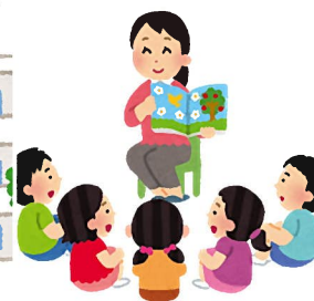
図書ボランティア