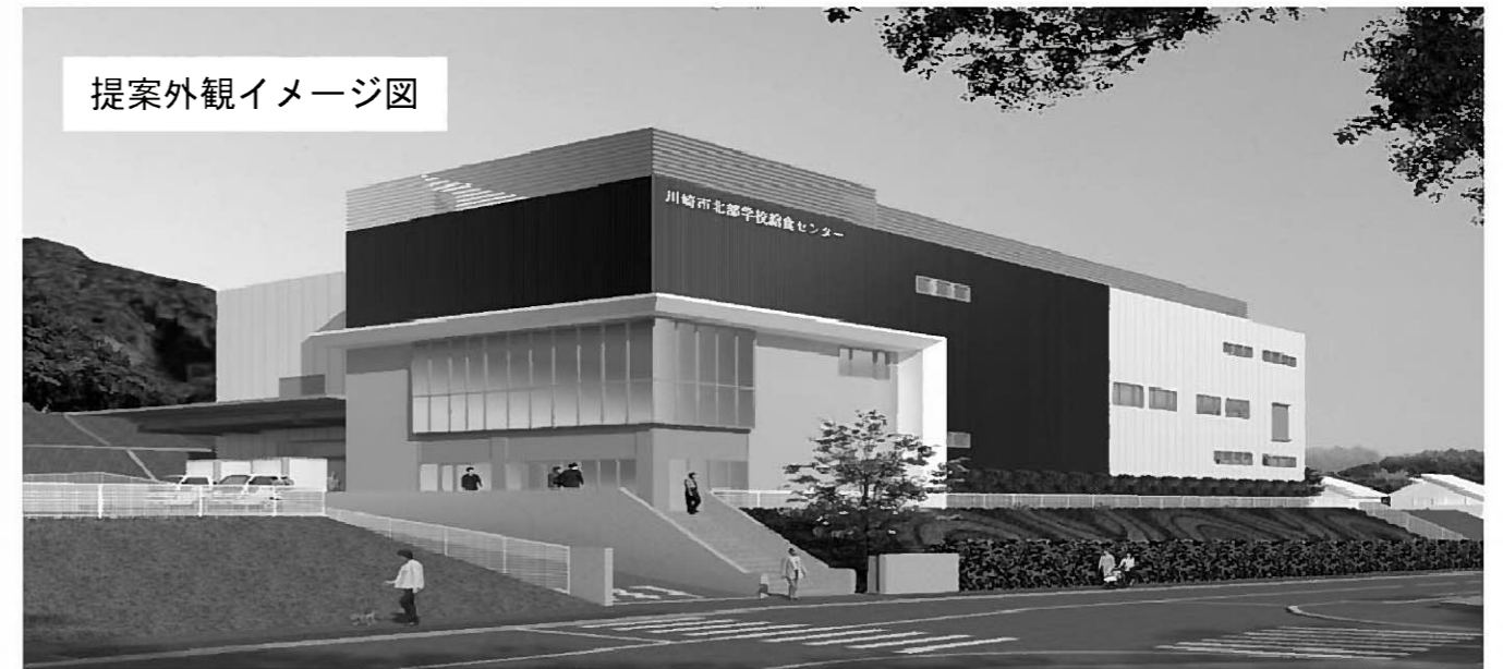
提案外観イメージ図

※本図は提案資料として提出されたものであり、実際のイメージとは異なる場合があります。