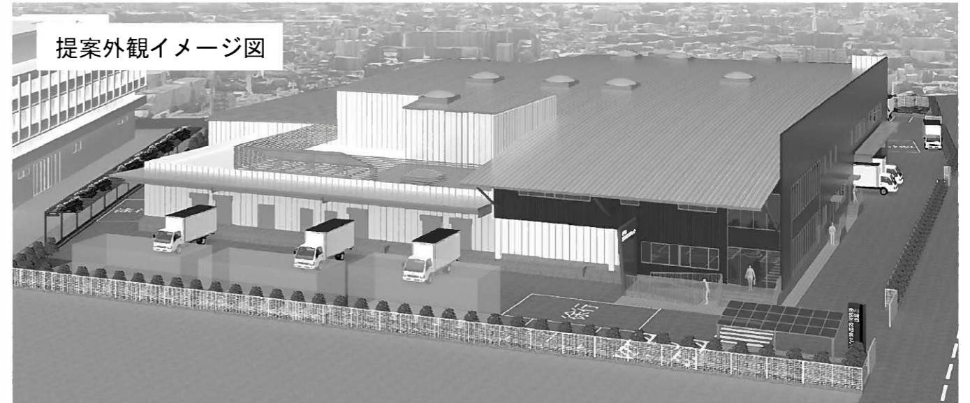
提案外観イメージ図

※本図は提案資料として提出されたものであり、実際のイメージとは異なる場合があります。