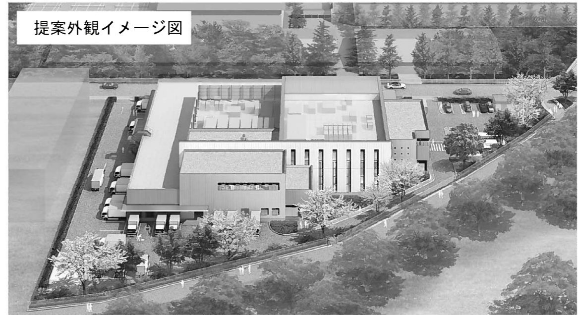
提案外観イメージ図

※本図は提案資料として提出されたものであり、実際のイメージとは異なる場合があります。