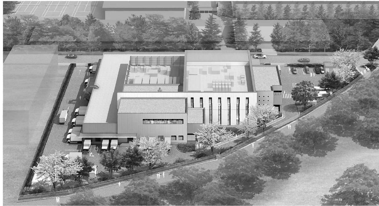
■ (仮称) 川崎市中部学校給食センター外観イメージ図