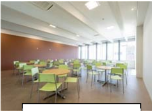
ラウンジヤマブキ