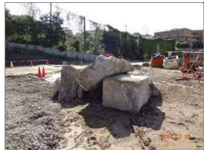
③ 撤去後の地中障害物(コンクリート構造物)