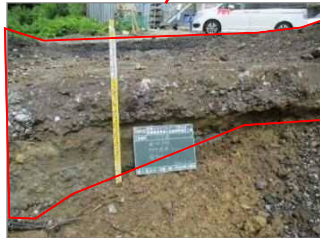
④ 地中障害物(アスファルト舗装)