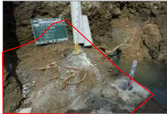
① 地中障害物(コンクリート構造物)