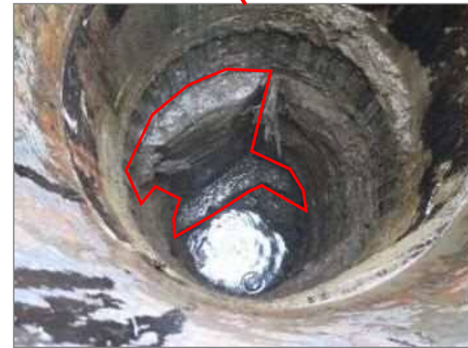
⑤ 地中障害物(コンクリート構造物)