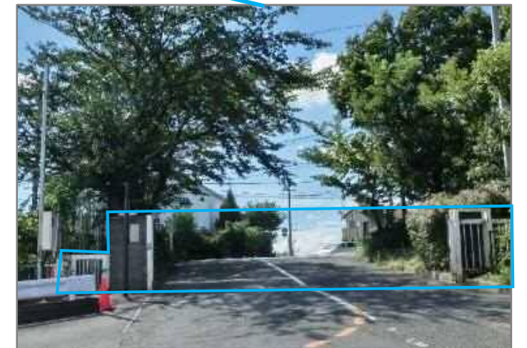
⑥ 追加工事(正門改修工事)