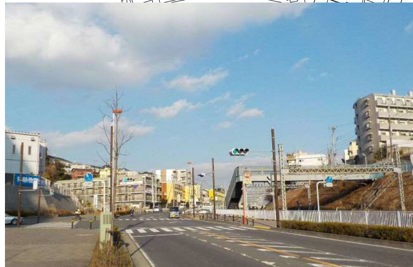
新百合ヶ丘駅方面から望む