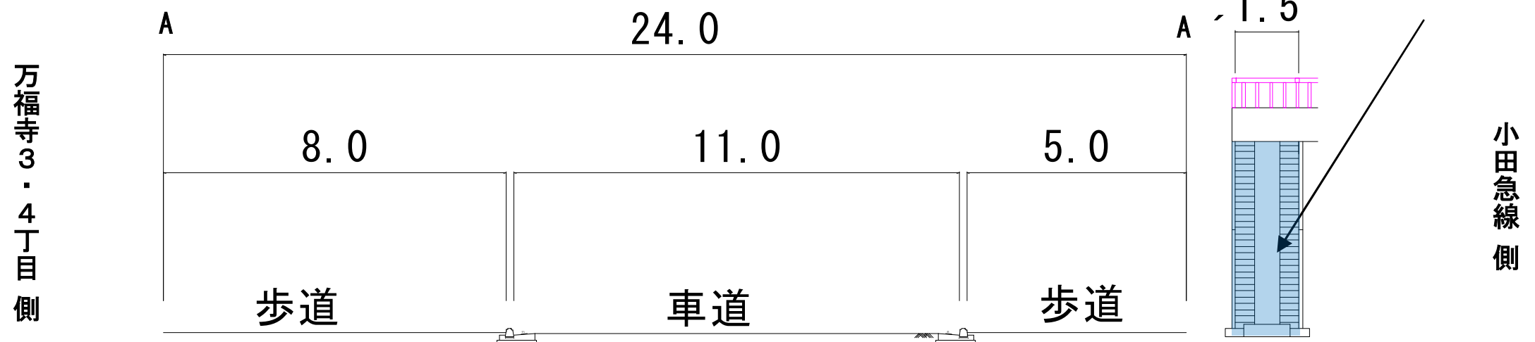
A-A' 横断面図 1:150