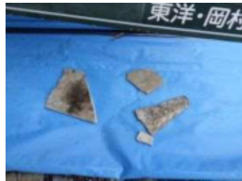
スレート建材採取状況