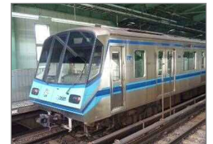
新百合ヶ丘への延伸について横浜市との事業化に向けた調整を進める横浜市営地下鉄 3 号線