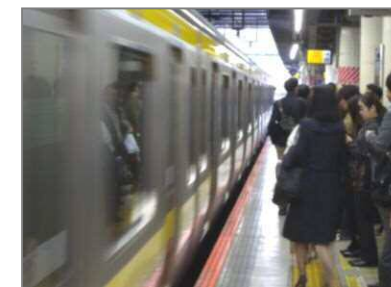
鉄道駅の安全性・利便性向上のため、鉄道事業者と連携した取組を進める必要がある JR 武蔵小杉駅