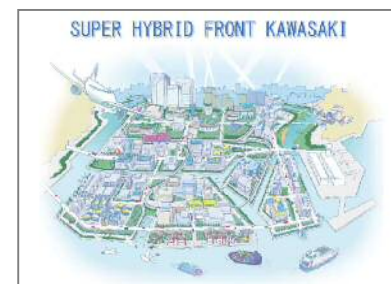
臨海部ビジョンと連携した次世代モビリティ等の活用など、先進的・先導的な技術の導入促進等に向けた取組を進める