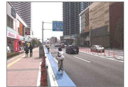
歩行者や自転車等が安全で安心して移動しやすい交通環境の整備等により、自転車の安全利用を推進するとともに、活用という視点からも取組を進める