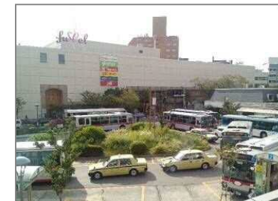
周辺地域における路線バスネットワークの拠点として、再開発に合わせて再整備を行う 鷺沼駅交通広場