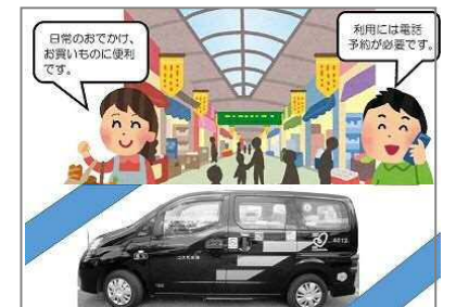
幅広い観点から地域の足を確保するための手法について検討を行い、持続可能な交通環境の整備に向けて、地域の特性やニーズに応じた取組を進める