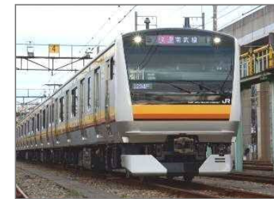
連続立体交差化や混雑緩和に向けた長編成化、オフピーク通勤による需要の調整などに取り組む JR 南武線