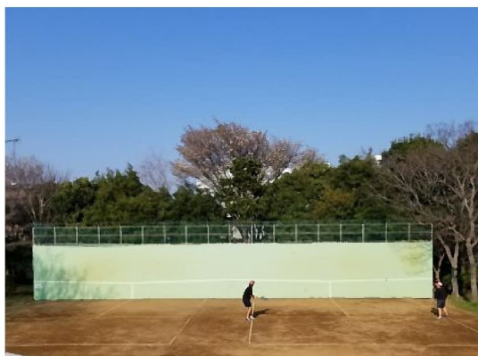
壁うちテニス用壁