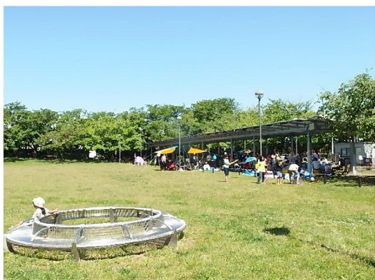
バーベキュー施設