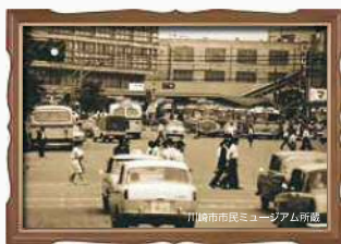
昭和41年当時の川崎駅北口

東西自由通路の供用開始に伴って廃止されましたが、駅構内の混雑が増大するなど、市民から再開が要望されました。