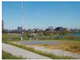
多摩川緑地小向町地区(幸区)

Q 少年たちがサッカーの練習などに使いやすいよう、グラウンドを含む広場の整備を行う必要があるが、対応は。 A 雑草が覆われている部分をグラスト舗装に復元するなどの整備を行っていく。