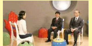
松原成文議長(中央) 後藤晶一副議長(右)

31年1月3日にテレビ神奈川で議長・副議長の「新春対談」が放映されました。対談の様子は川崎市議会のホームページからご覧いただけます。