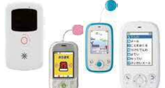
携帯型緊急通報システム(一部加工しています)

Q 利用対象者への案内として地域包括支援センターが主の対応では不十分であり、申請対応窓口を拡充すべきでは。 A 支援を必要とする高齢者に適切なサービスを的確に提供することが重要と考えており、地域包括支援センターなどの相談支援機関できめ細やかな対応を図るとともに、イベント時に普及啓発を行うなど、より一層の広報に努めていきたい。