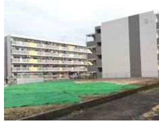
市営有馬第2住宅(宮前区)

保育園が移転することとなったが、その跡地利用として高齢者の地域密着型施設の検討はしているのか。高齢化率が高い地域のため、有効な活用方法とされており、関係部署で連携しながら積極的に調整を進めていきたい。