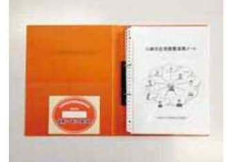
市在宅療養連携ノート

Q 現状と課題は。 A 各医療機関で必要に応じて活用しているが、法人や事業所間をまたいだ連携を調整する仕組みの構築が重要な課題だと認識しており、実効性のある多職種連携体制の構築に向けて取り組んでいきたい。