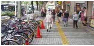
新川通りの通行環境