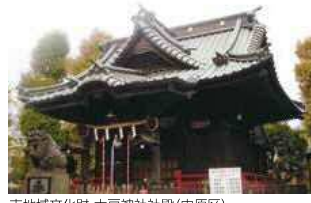
市地域文化財 大戸神社社殿(中原区)

Q 地域に根ざし、受け継がれてきた市地域文化財(★13)の維持管理への助成は。 A 補助金などの助成はないが、台帳での記録管理や定期的な現況確認などにより、適切な保護と活用を推進していく。