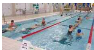
障害者スポーツデー水泳教室

Q 練習場所の確保を、当市としても支援していくべきでは。 A 水泳は障害のある人にも取り組みやすいスポーツであり、プールをより利用しやすいよう、関係団体や施設管理者などと検討していきたい。