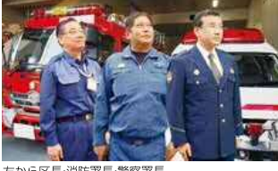
左から区長・消防署長・警察署長

Q 区役所・警察署・消防署が連携した取り組みによる消防活動の効果は。 A 中原区における「MEZASHI」の結成は、区の安全・安心を目指すという共通認識がさらに深められ、消防活動上においても大きな効果が得られると考えている。