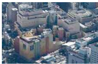
ラ チッタデッラ(川崎区)

Q 南側は「ラ チッタデッラ(★4)」があり、娯楽性の高い地域でもあるが、まちづくりをどのように検討しているのか。 A 将来的に、さいか屋敷地周辺などの再開発が望ましいと考えており、関係権利者と勉強会を通じ、まちづくりの方向性などの意見交換を重ねている。地域のポテンシャルを生かし、多様な都市機能の集積などを図り、活力と魅力にあふれた持続可能なまちづくりを推進していく。