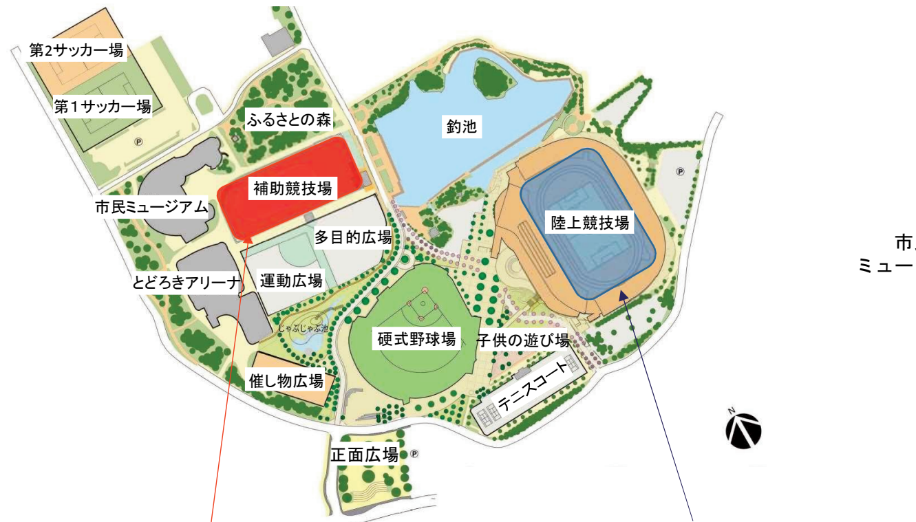
＜等々力緑地再編整備実施計画のイメージ図＞