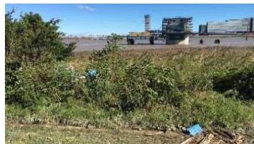
② 川崎側、架橋位置から望む