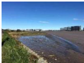
③ 川崎側、下流から望む