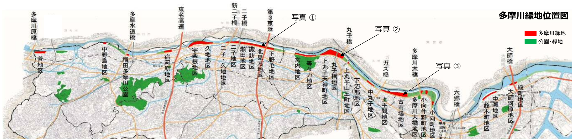
多摩川緑地位置図