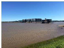
① 川崎側、上流から望む