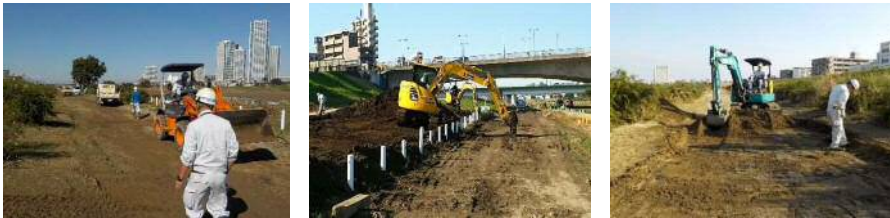
① 北見方地区 ② 丸子橋地区 ③ 古市場地区

可及的速やかな復旧に向け、既存の予算枠などを活用し、マラソンコースから順次土砂の撤去等の災害復旧緊急工事を実施中