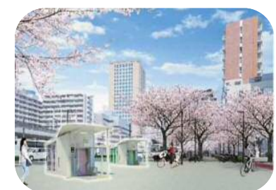
駐輪場整備イメージ(地下機械式)