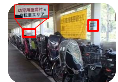
自転車の大型化対応