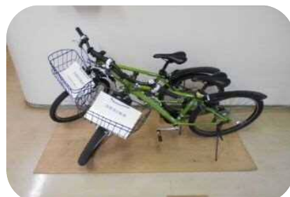
災害用自転車の配置事例

⇒災害時における被災状況の迅速な把握のため、災害用自転車を配備し、情報伝達などへの有効活用について検討