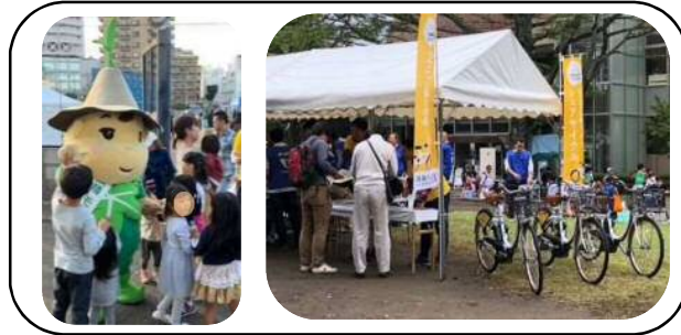
利用促進キャンペーン