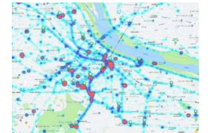
【(少)水色⇒青色⇒赤色(多)】 (ヒートマップ分析の例) ビックデータの一例(ヒートマップ※)