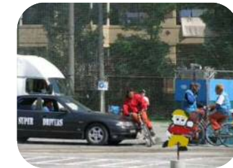
ルール・マナー周知状況