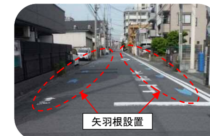
生活道路の安全対策