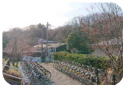
生田緑地でのシェアサイクルポート