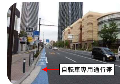
幹線道路の整備に合わせた整備