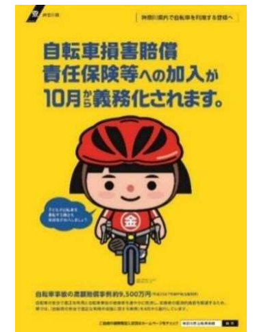
自転車損害賠償責任保険等への加入促進