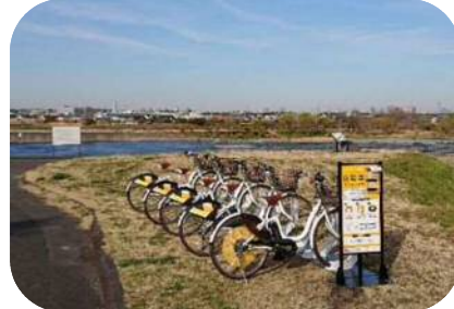
多摩川沿いのシェアサイクルポート