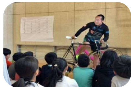
小学校での出張授業