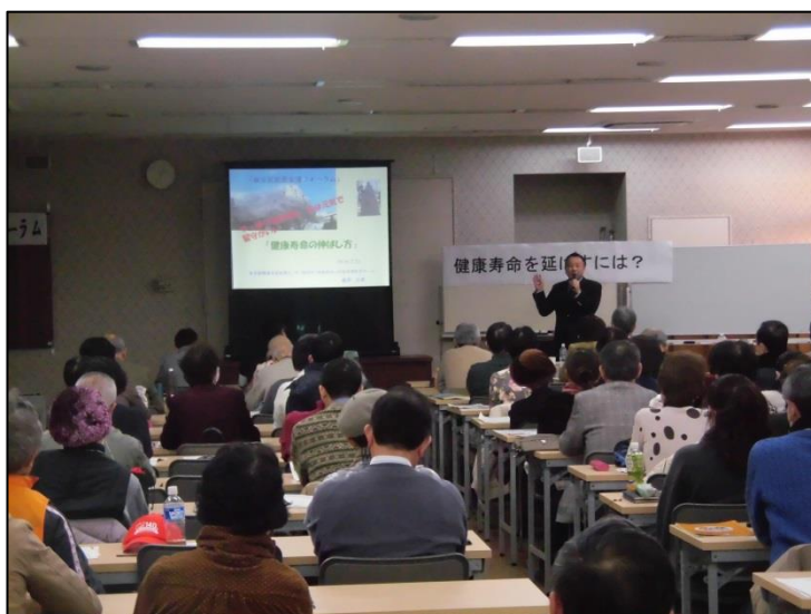
皆さん、講演を熱心に聞いていました