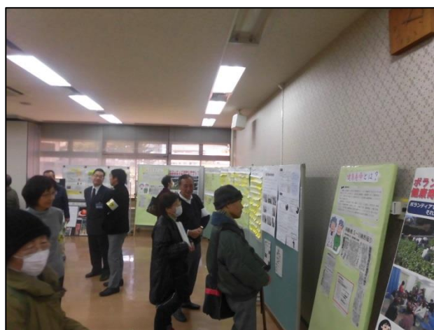
展示コーナーの様子

今回の区民会議フォーラムの報告や各部会の審議状況などは、今後、麻生区区民会議のホームページで公開する予定です。